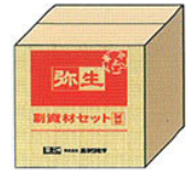
弥生副資材セット (段ボール)

⚠ 塗厚、下地状況などにより 施工面積は変わります。 積算については お問い合わせ下さい。